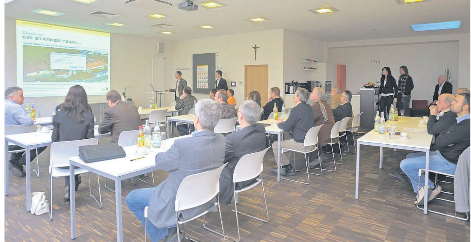
Im neuen Schulungszentrum der Firma Döpfner mit 26 Plätzen werden Außendienstmitarbeiter mit den Vorzügen von Fenstern aus heimischem Holz vertraut gemacht.